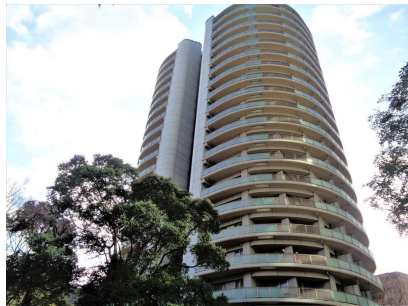
現地外観写真 現地(2023年1月)撮影