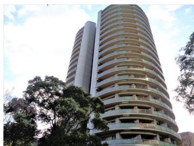
現地外観写真 現地(2023年1月)撮影