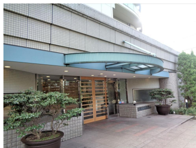
エントランス エントランスアプローチ